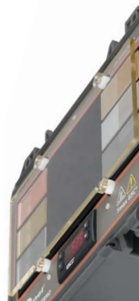
Osłona części czołowej (przesłona)