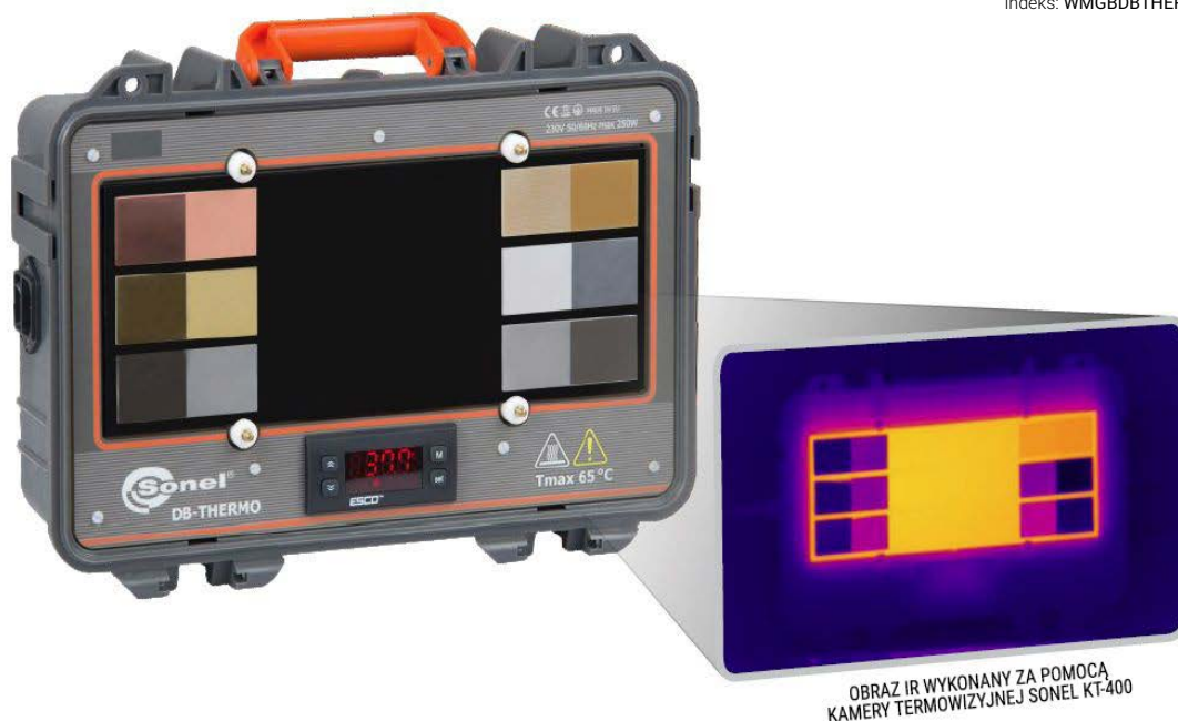
OBRAZ IR WYKONANY ZA POMOCĄ KAMERY TERMOWIZYJNEJ SONE! KT-400