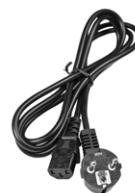
Przewód do zasilania 230 V (wtyk IEC C13)